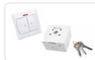
Nyomógombos és kulcsos átkapcsolók