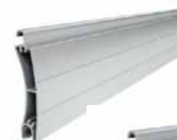
PE 55 Profil magassága: 55 mm Vastagsága: 14 mm