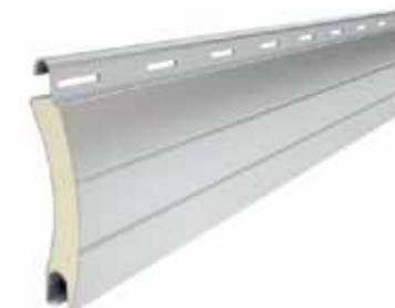
PA 55 Profil magassága: 55 mm Vastagsága: 14 mm