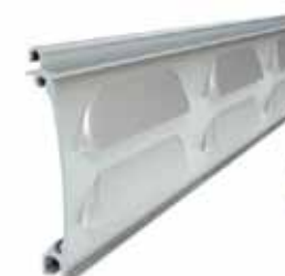
PEW 77 Profil magassága: 77 mm Vastagsága: 14,5 mm