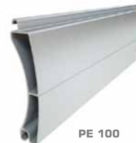
PE 100 Profil magassága: 100 mm Vastagsága: 25 mm