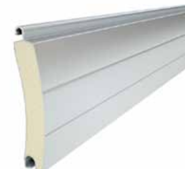
PA 77 Profil magassága: 55 mm Vastagsága: 14 mm