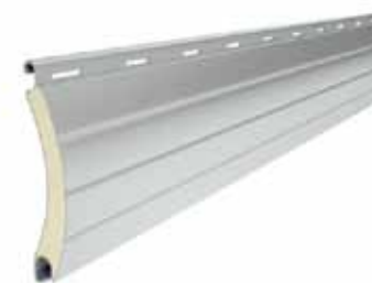
PA 52 Profil magassága: 52 mm Vastagsága: 13 mm

Habbal kitöltött, alábbi típusú alumínium profilok: